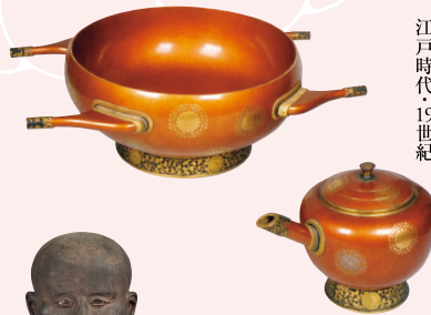
菊紋蒔絵角盥椀 椀 伝仁孝天皇御遺品 江戸時代・19世紀