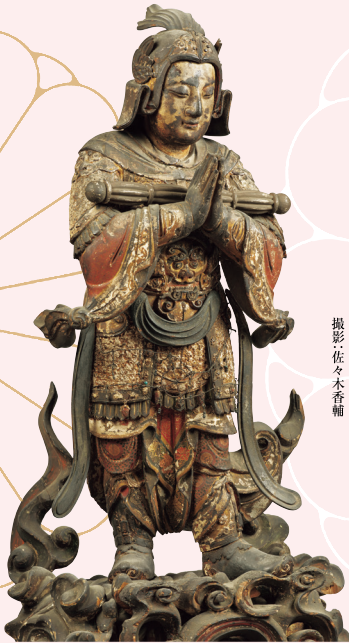
重要文化財 韋駄天立像 中国 南宋時代・13世紀