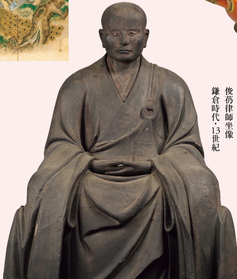
俊苧律師坐像 鎌倉時代・13世紀

[公式サイト] https://sennyu-ji2027.exhibit.jp/