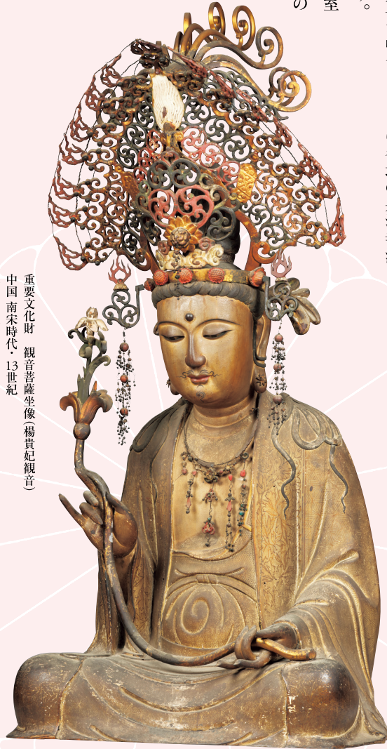
重要文化財 観音菩薩坐像 楊貴妃観音 中国 南宋時代・13世紀