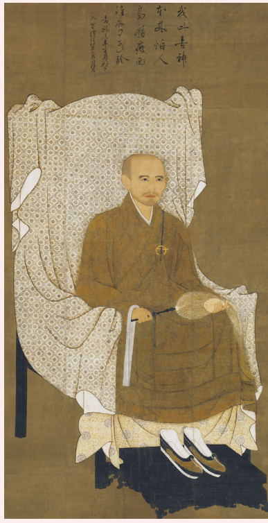
重要文化財 俊苧律師像 鎌倉時代・嘉祿3年(一二二七)

本展は、泉涌寺創建八〇〇年と俊苧律師八〇〇年遠忌を契機に開催される初の大規模展覧会です。俊苧ゆかりの宋代仏教美術の傑作や、歴代天皇・皇族にまつわる貴重な品々、さらには各地の泉涌寺派寺院の至宝を一堂に公開します。美しく荘厳な祈りの造形と、皇室とともに歩んだ深遠なる「御寺」の全貌に迫ります。