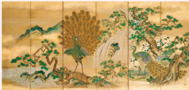
孔雀図屏風 鶴沢探索筆 後桃園天皇御遺品 江戸時代・18世紀