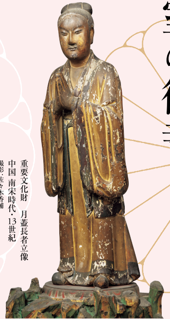
重要文化財 月蓋長者立像 中国 南宋時代・13世紀